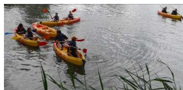
Juillet 2010 - Activité canoë sur le Loir, au départ de Briollay

L'intégralité des formules sera présentée lors du prochain numéro (Juillet-août 2011) des Echos de l'AESA .