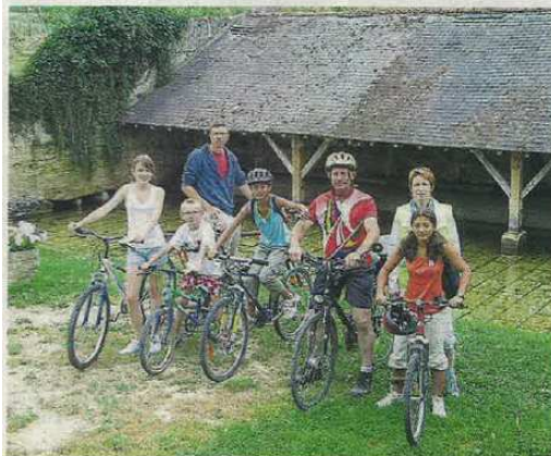
Les adeptes du vélo en famille seront comblés le mercredi soir.

Cet été, l'Office de tourisme reconduira les animations qui connaissent un succès sympathique, notamment le pot d'accueil chaque semaine aux Fontaines, le jeu de piste en ville et le Cluedo troglodyte aux Arènes. Mais il y aura aussi une nouveauté, destinée à se bouger pour garder la forme. Tout le monde, touristes ou habitants du Douessin, sera invité à des séances de jogging et de vélo touristique, le