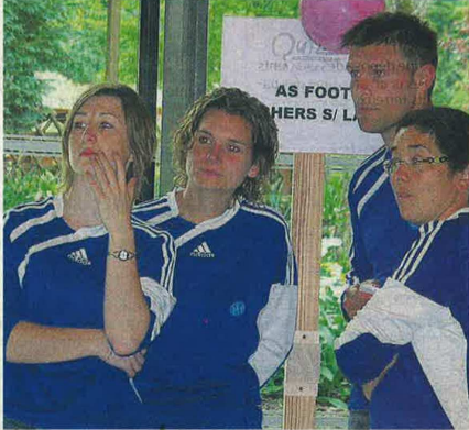
Sans faire de bruit, le quatuor des Verchers a assuré sa place en finale départementale.

L'AESA, Anjou emploi sport animation, basée aux Ponts-de-Cé, emploie 90 éducateurs sportifs qui sillonnent le département à la demande des clubs, des collectivités locales, des établissements scolaires. Censée également conseiller les clubs sur la législation sportive, elle vient d'inventer, avec le Comité olympique de Maine-et-Loire, un moyen sympa de faire de la formation : un quiz ludique auquel toutes les structures sportives sont invitées à participer. Jeudi soir à Doué-la-Fontaine, dans la salle des arènes, sept clubs du Saumurois étaient là pour tenter leur chance : le Club de voile