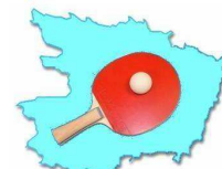
Comité de Maine et Loire de tennis de Table